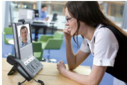
パーソナルビデオコミュニケーション