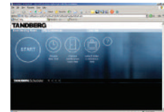
スケジューリング