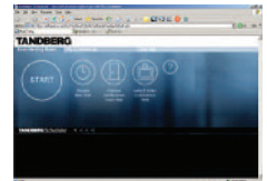
スケジュールリング