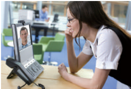
パーソナルビデオコミュニケーション